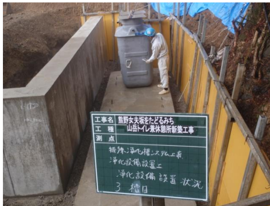
ダブルクリーン設置