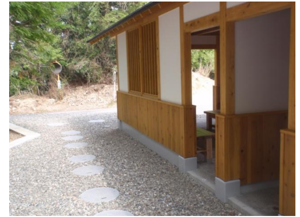
女性トイレ入り口