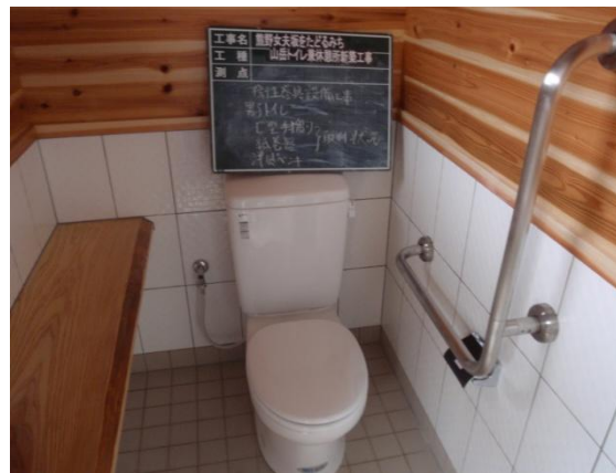
便器は清潔感あふれる白