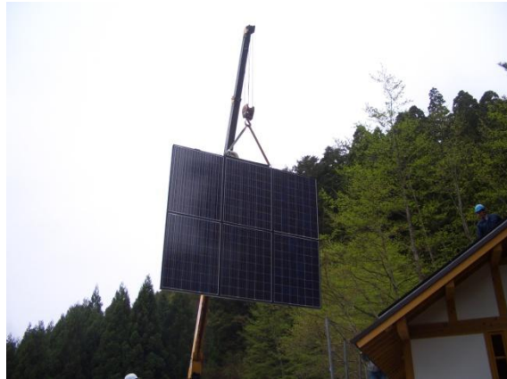
太陽光モジュール