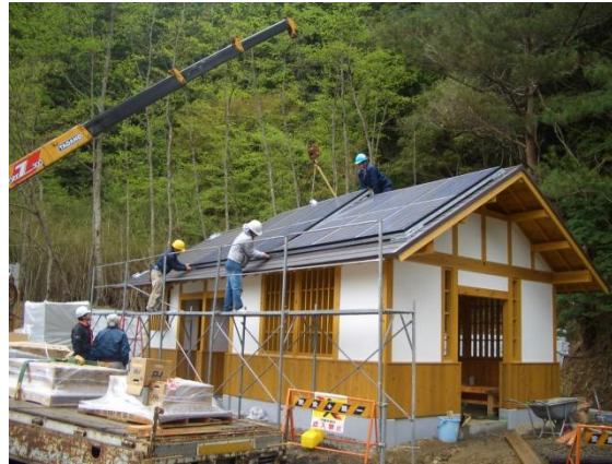
太陽光モジュール取付