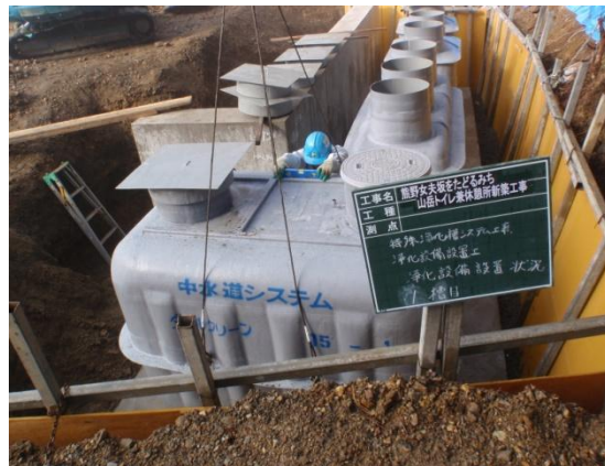
ダブルクリーン設置