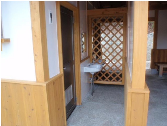
男性トイレ入り口